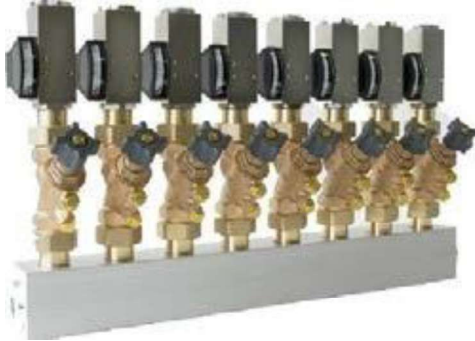
그림) 밸브 및 유량 스위치 M101를 지닌 밸브 블록 VB2-020GA8