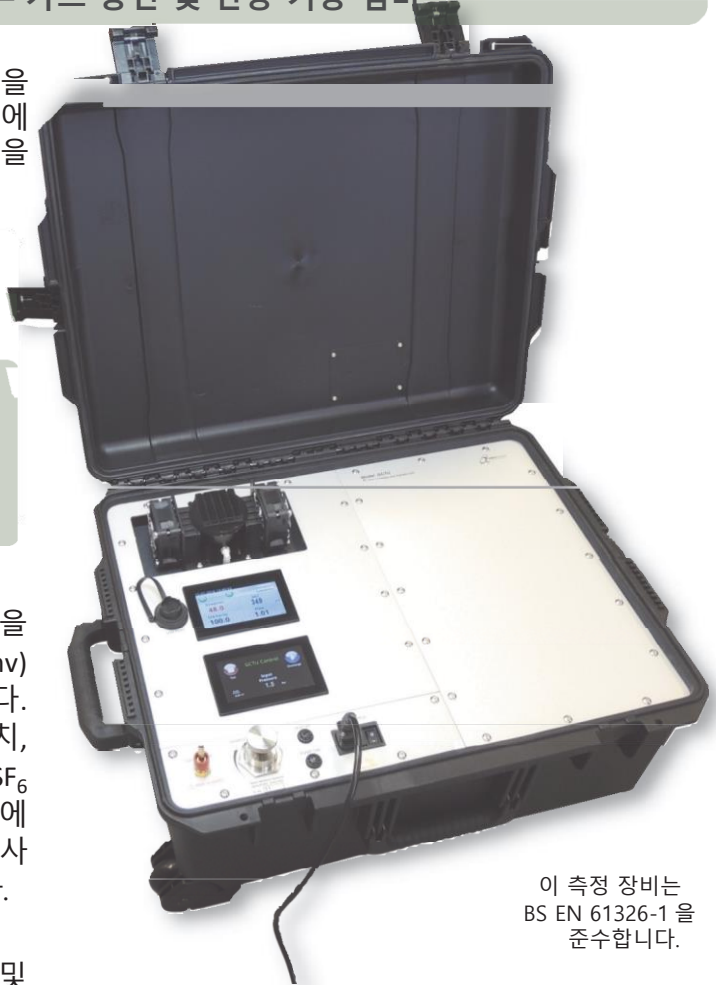
이 측정 장비는 BS EN 61326-1 을 준수합니다.

사용자는 연결, 유량 조절, 샘플 채취, 측정 및 기록, 반송 작업만 하면 되며, 이 작업은 정화 시간을 포함해 보통 5 분 이내에 끝납니다.